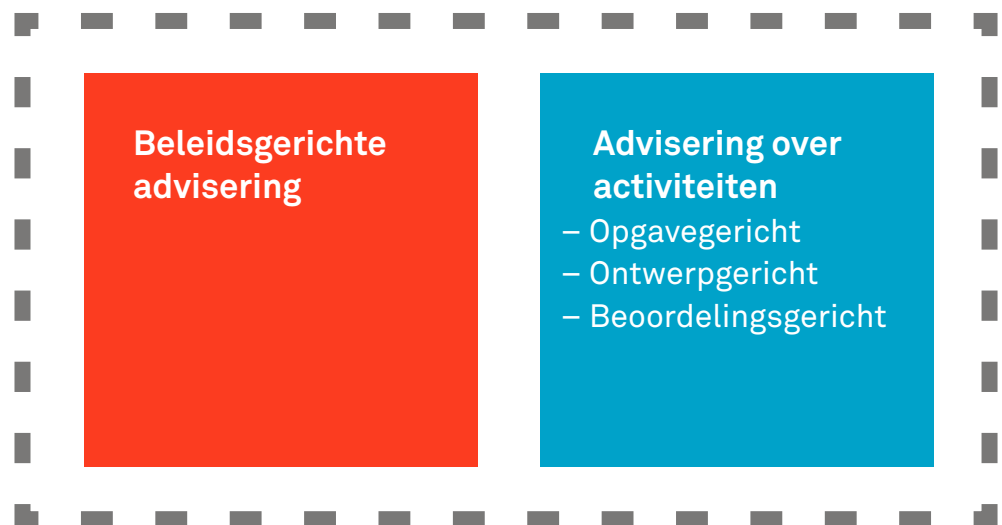
Figuur 5 Samenhang is de essentie van het adviesstelsel

Dit vergt keuzes met betrekking tot de context en de reikwijdte van de advisering, en de samenhang tussen verschillende adviesrollen. Deze keuzes hangen samen met de aard van de omgevingsvisie en het omgevingsplan. De gemeenteraad moet besluiten hoe het adviesstelsel, de som der delen, vorm krijgt. Samenhang is de essentie van een ‘eenvoudig beter’ lokaal adviesstelsel.