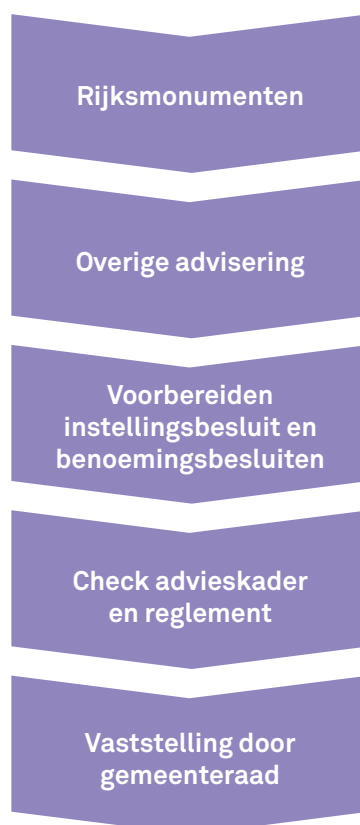
Figuur 1 Kwaliteitsadvisering continueren in vijf stappen

De bepalingen over de adviescommissie(s) uit de erfgoedverordening en de bouwverordening kunnen niet zonder meer worden omgezet. Een test in enkele gemeenten wijst uit dat het handig is om een matrix te maken waarin de artikelen uit de bestaande verordeningen en reglementen naast de artikelen uit de voorbeeldregels in het nog te verschijnen Deel 2 geplaatst worden. Dit helpt bij het denkproces van bestaand naar nieuw. De instelling van een gemeentelijke adviescommissie – zelfs al is dit een voortzetting van de huidige situatie – kan in feite niet los gezien worden van het bredere transitieproces om het kwaliteitsbeleid onder de Omgevingswet uit te werken. In hoofdstuk 5 besteden we daar aandacht aan. In dit hoofdstuk beschrijven we ‘sec’ hoe gemeenten te werk kunnen gaan bij het omzetten van het huidige adviesstelsel. Dit is kort dag: het instellen van een gemeentelijke adviescommissie is voor alle gemeenten met gebouwde en aangelegde rijksmonumenten een wettelijke plicht die bij het inwerkingtreden van de Omgevingswet op orde moet zijn.